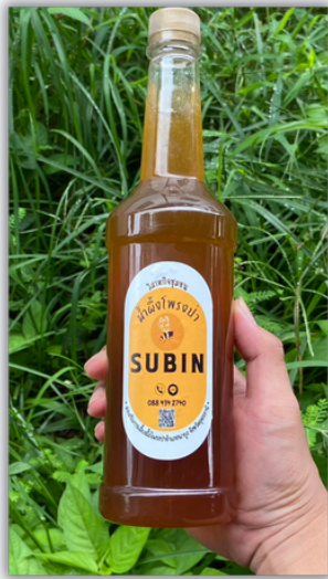
น้ำผึ้งโพรง ปริมาณ 750 ml.