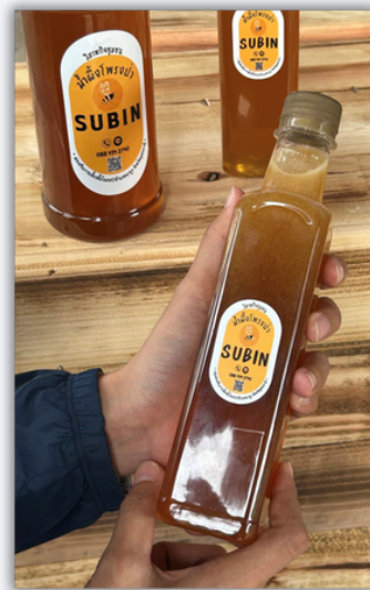
น้ำผึ้งโพรง ปริมาณ 120 ml.