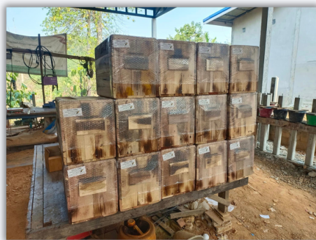
กล่องเลี้ยงผึ้งโพรง