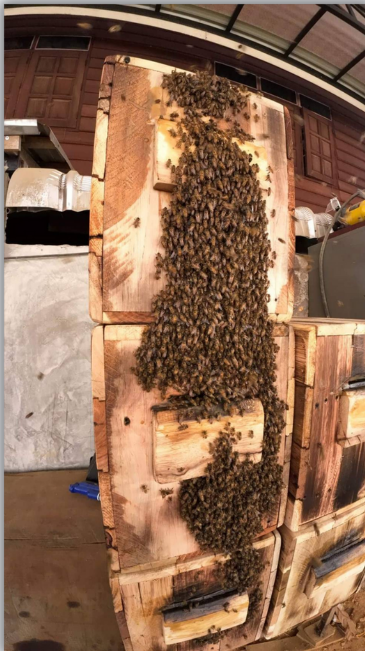
ภาพ ผึ้งเข้ารังประสบความสำเร็จ