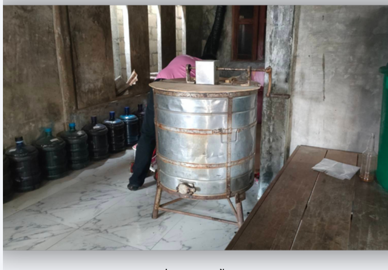
เครื่องสไลด์รวงผึ้งแรงมือ