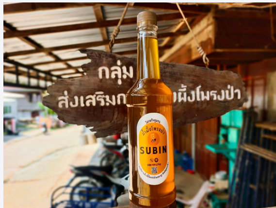
บรรจุภัณฑ์น้ำผึ้งโพรงของกลุ่มส่งเสริมการเลี้ยงผึ้งป่า